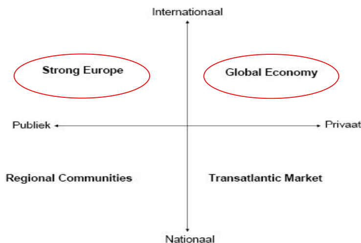
Figuur 2 Sleutelonzekerheden en de vier scenario's